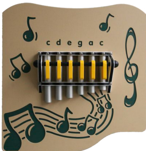
panneau standard : sans texte