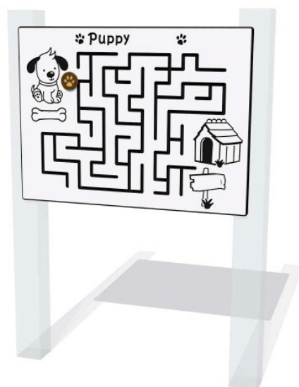
panneau standard : sans texte

Conçu selon la norme EN 1176, mais en fait cette norme n'est pas applicable sur des panneaux.